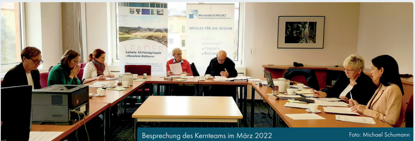
Besprechung des Kernteams im März 2022

Die lokale LEADER Aktionsgruppe »Mansfeld-Südharz« (LAG MS) möchte sich mit einem überzeugenden Konzept wieder als LEADER/CLLD-Region für den Zeitraum bis 2027 in Sachsen-Anhalt bewerben. Dieses Konzept wird aktuell erarbeitet. Dazu wurde ein Kernteam gebildet, welches die Arbeiten koordiniert, bevor die Mitgliederversammlung berät und entsprechende Beschlüsse fassen kann.