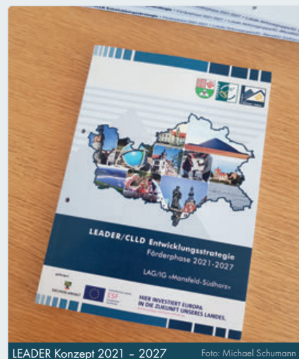
LEADER Konzept 2021 – 2027

Die Kreisverwaltung kann, nach Öffnung des Verfahrensweges durch das Landesverwaltungsamt, die Fördermittel für das neue LEADER-Management beantragen und die europaweite Ausschreibung durchführen. Nach Beauftragung des neuen Managements wird auch wieder ein ständiger Ansprechpartner für die Akteure im LAG-Gebiet zur Verfügung stehen.