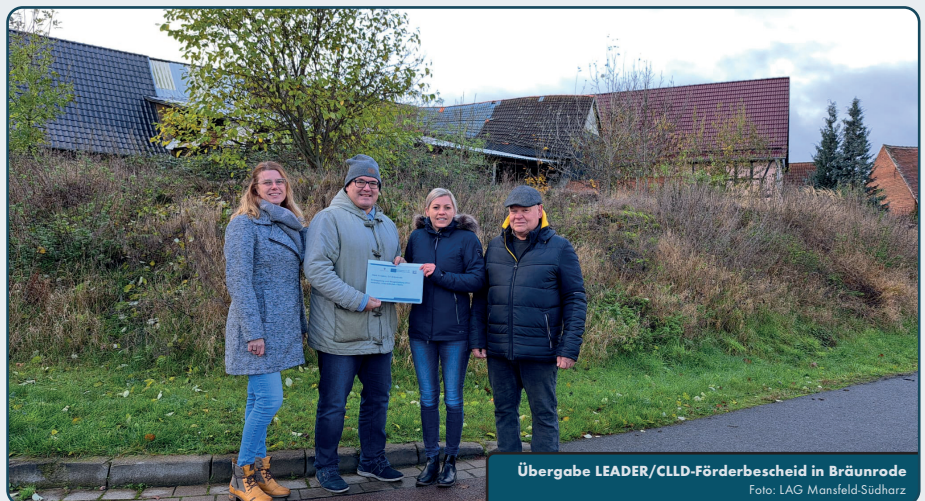
Übergabe LEADER/CLLD-Förderbescheid in Bräunrode

Die LAG Mansfeld-Südharz wünscht viel Erfolg bei der Umsetzung des Projektes.