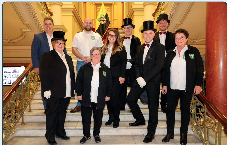
Die Pfingstgesellschaft Blankenheim in „Montur“ in der Staatskanzlei Magdeburg