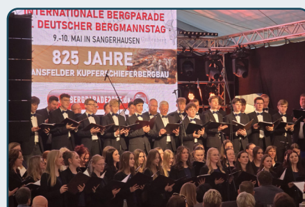
Festveranstaltung 825 Bergbau im Mansfelder Revier