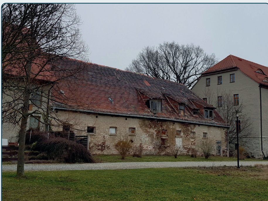
Der Abriss dieses Gebäudes auf dem Areal des Klosters Helfta wurde durch die LEADER/CLLD-Förderung unterstützt

In der aktuellen Förderperiode existierte im Bereich des EFRE-Fonds ein Gegenstand der Förderung, der „Altlastensanierung und Bodenschutz“ beinhaltet. Projekte, die unter diesem Gegenstand der Förderung eingereicht werden, belasten das zugewiesene Budget der LAG, den sogenannten „Finanziellen Orientierungsrahmen“ nicht. Dieser Fördergegenstand macht es also möglich, zusätzliche Fördermittel für das LAG-Gebiet, unseren Landkreis Mansfeld-Südharz, zu akquirieren.