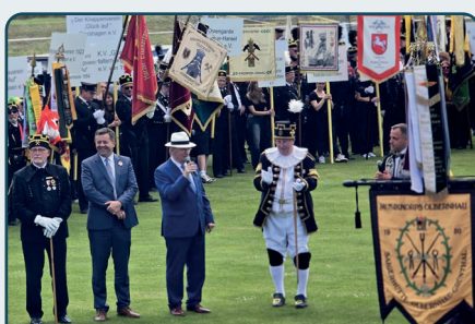
Grüßwort vom Ministerpräsidenten des Landes Sachsen-Anhalt, Dr. Reiner Haseloff

Der Abschluss des 14. Deutschen Bergmannstages fand am 11. Mai 2025 im Friesenstadion von Sangerhausen statt.