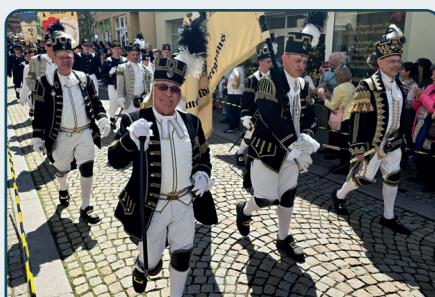
Internationale Bergparade in Sangerhausen