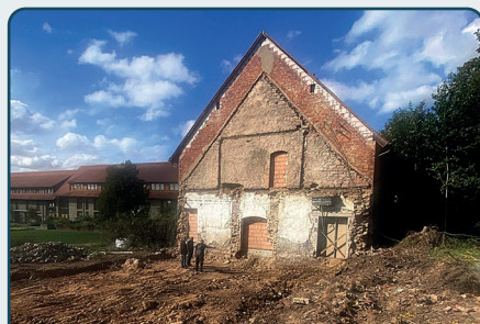
Baufreiheit für Neues ist geschaffen

Im Vorstand und dem Management wurden verschiedene Aktivitäten unternommen, um eine schnelle Antragstellung bei der Investitionsbank Sachsen-Anhalt durch die Projektträger möglich zu machen. Eile war geboten, da die Mittel auf 20 Mio. Euro für die aktuelle Förderperiode und unser gesamtes Bundesland begrenzt sind.