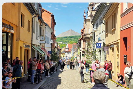
Internationale Bergparade in Sangerhausen