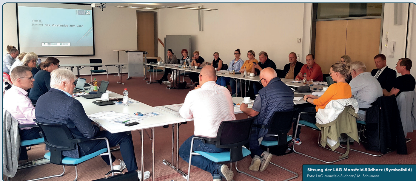
Sitzung der LAG Mansfeld-Südharz (Symbolbild)

Ob diese jedoch möglich ist, bleibt abzuwarten - Gespräche mit dem Finanzministerium des Landes Sachsen-Anhalt sind vorgesehen.