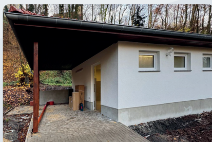
Außenansicht des neuen Wirtschaftsgebäudes

rissen und ein neues Wirtschaftsgebäude errichtet. Das Innenmaß beträgt 6 x 7 Meter für zwei Räume. Das Gebäude erhält zusätzlich einen überdachten Bereich und eine gepflasterte Fläche zur besseren Anlieferung von Futter. Die Brauchwasserversorgung wird größtenteils über aufgefangenes Regenwasser erfolgen.