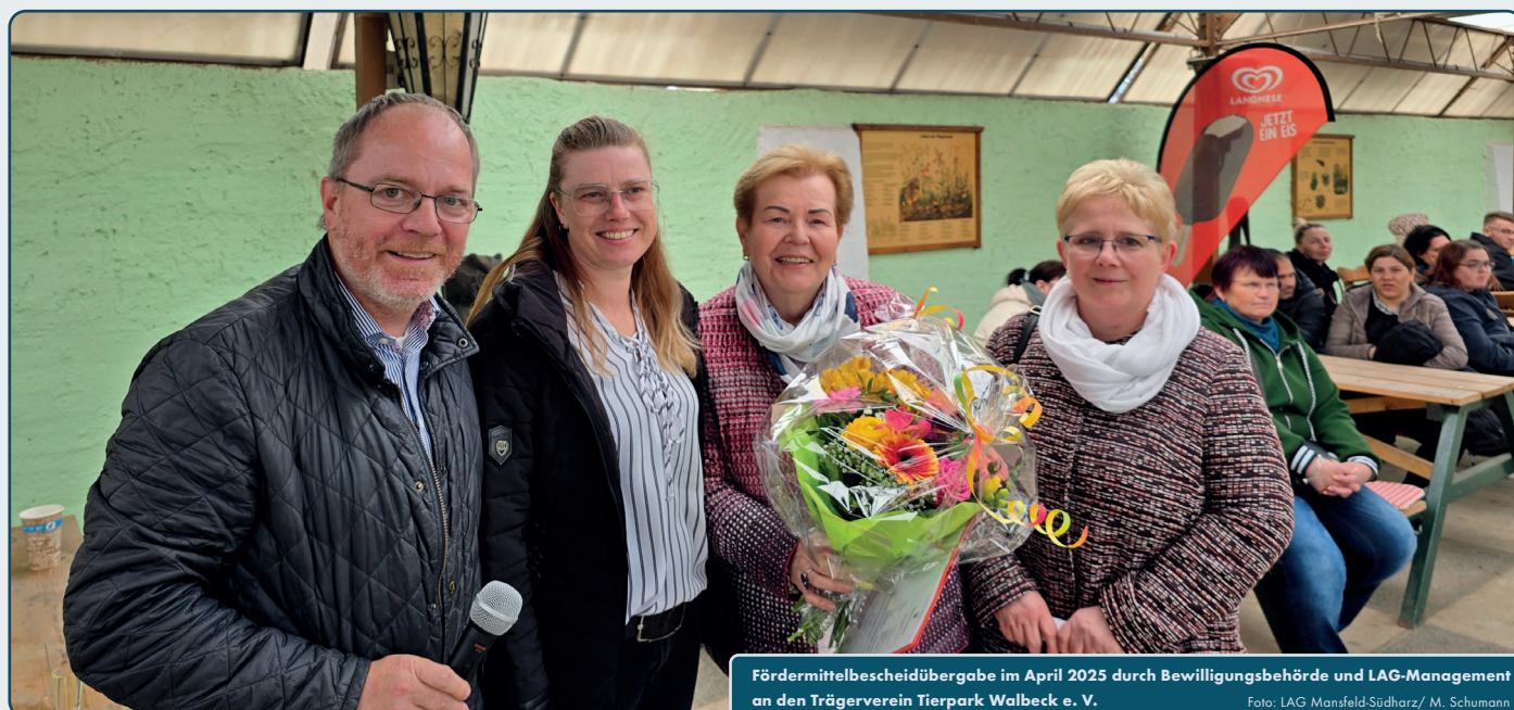
Fördermittelbescheidübergabe im April 2025 durch Bewilligungsbehörde und LAG-Management an den Trägerverein Tierpark Walbeck e. V.

Der Trägerverein Tierpark Walbeck e. V. wirkt seit vielen Jahren in der LAG Mansfeld-Südharz mit. So wurden mit Unterstützung des LEADER-Programms bereits der Eingangsbereich des Tierparks neu gestaltet, ein Kommunikationszentrum gebaut, die Toilettenanlage für Besucherinnen und Besucher modernisiert oder Gehege und Stützmauern erneuert.